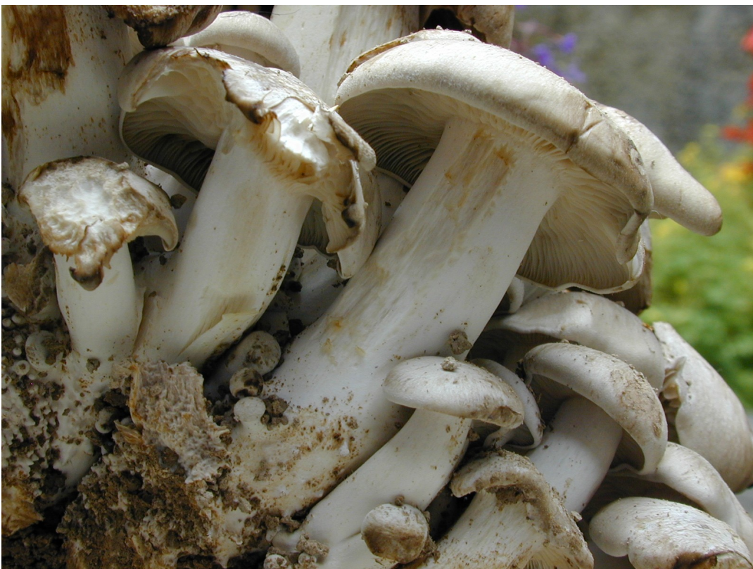
Récolte plus ancienne, les champignons poussaient dans une cave.