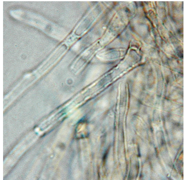
Hyphes du revêtement