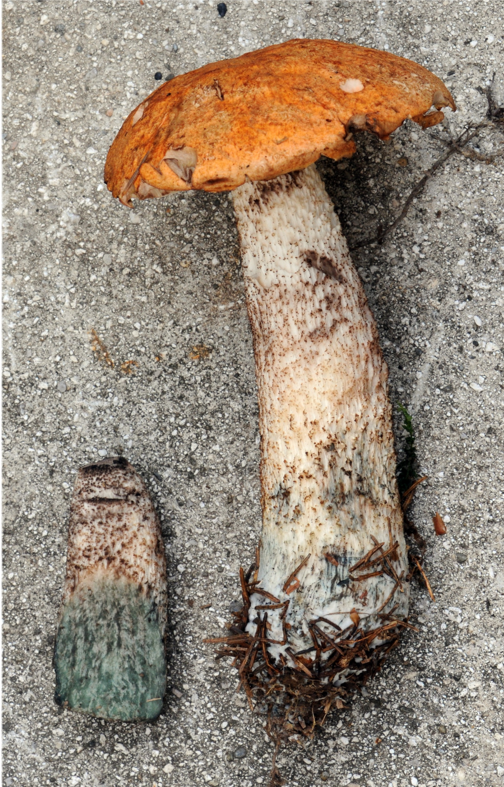
Verdississement du pied