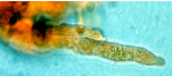
Cheilocystides à contenu jaune olivâtre

Les spores sont elliptiques, fluettes selon les auteurs de