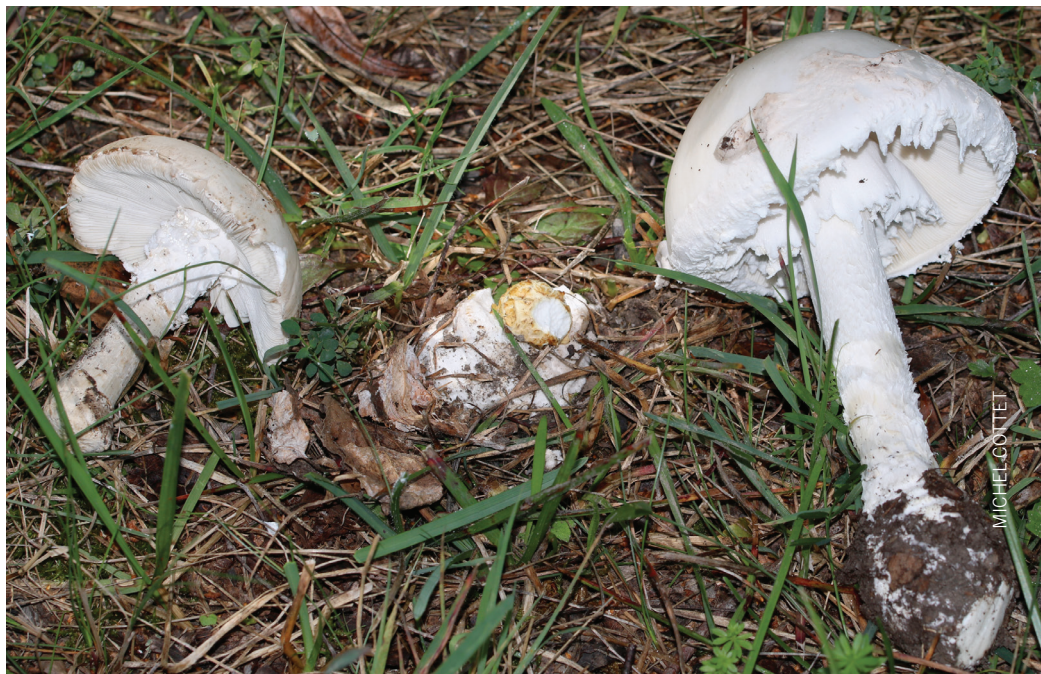
Fig. 3 SQUAMANITA SCHREIERI en compagnie de son hôte: Amanita strobiliformis Abb. 3 Der Gelbe Schuppenwulstling mit seinem Wirt dem Fransigen Wulstling

D'après Swissfungi4, on a trouvé en Suisse 4 espèces, toutes très rares (entre 1 et 10 observations pour la période 1991-2018), et une cinquième est documentée par Breitenbach et Kränzlin (1995). Nous avons voulu accompagner la présente note par des planches originales dessinées à partir de différentes sources (photos d'Internet et littérature diverse).