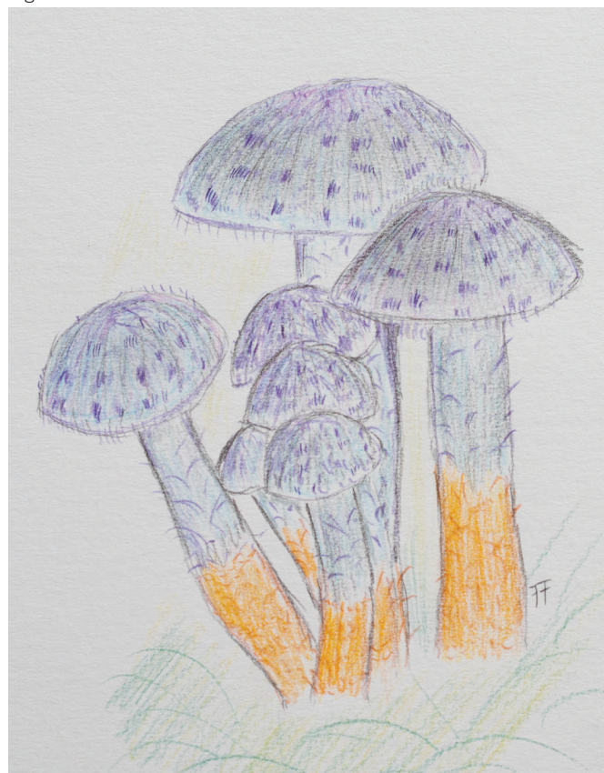
Fig. 6 | Abb. 6 SQUAMANITA PARADOXA

REDHEAD S.A., AMMIRATI J.F., WALKER G.R., NORVELL L.L., PUCCIO M.B. 1994. Squamanita contortipes , the Rosetta Stone of a mycoparasitic agaric genus. Canadian Journal of Botany 72: 1812-1824.