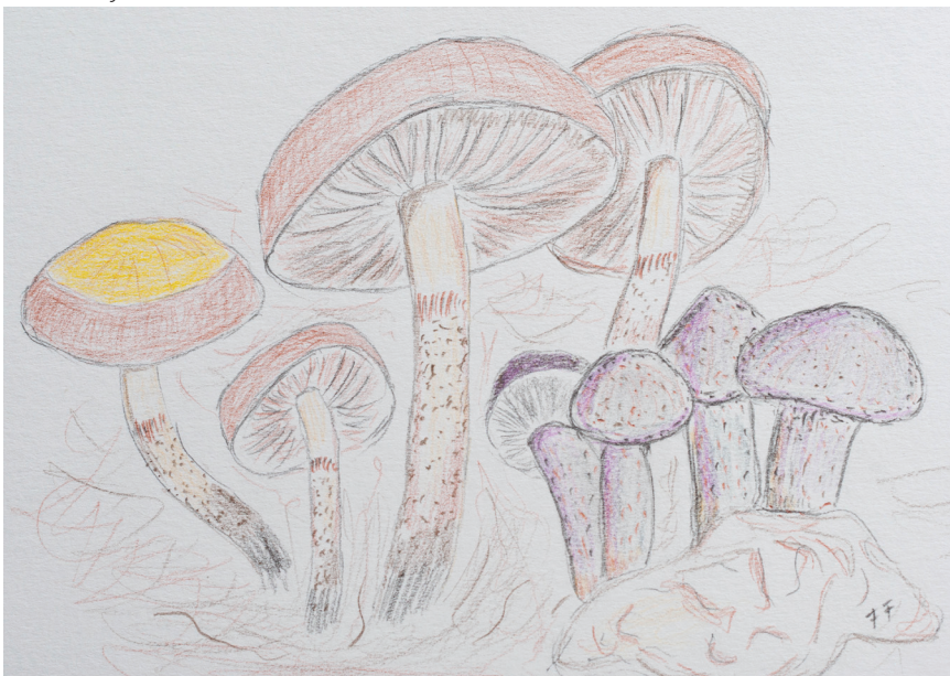
Fig. 8 SQUAMANITA FIMBRIATA avec son espèce-hôte, la pholiote changeante ( Kuehneromyces mutabilis )