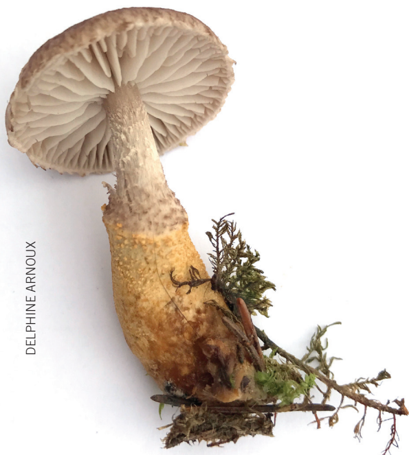
Abb. 2 Der Gelbe Schuppenwulstling, gefunden im Naturschutzgebiet Fanel im September 2018.