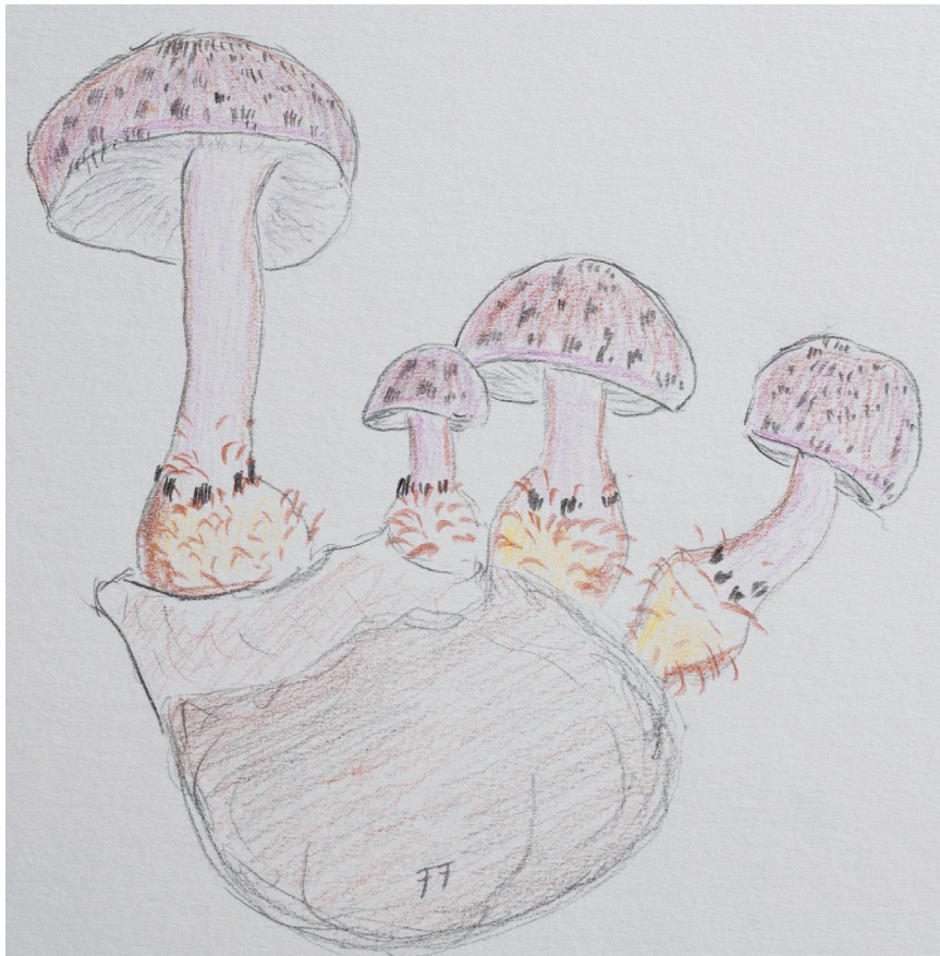
Abb. 7 | Fig. 7 SQUAMANITA ODORATA Duftender Schuppenwulstling

Da dieser Pilz nur einen sterilen Hut ausgebildet hatte, verzichtete ich auf eine komplette Beschreibung. Ich habe jedoch Bilder gemacht und das Exsikkat ins Herbarium Genf geschickt (N° G00273781), damit es in Zukunft für eventuelle weitere Untersuchungen zur Verfügung steht. Eine mikroskopische Untersuchung zeigte an der Basalknolle des Pilzes eine Vielzahl von Chlamydosporen (Abb. 4).