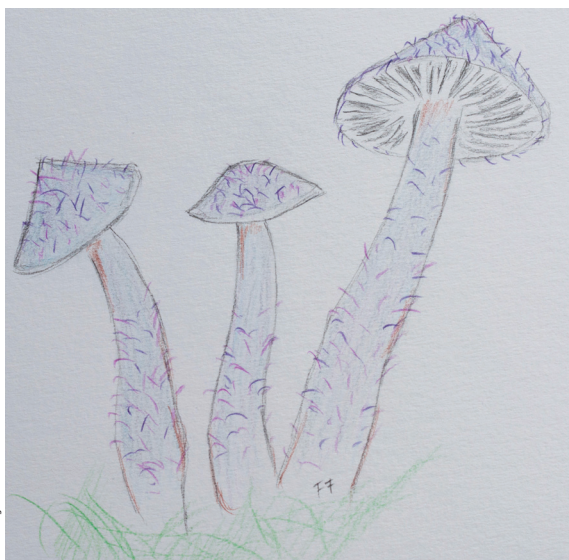
Abb. 9 | Fig. 9 SQUAMANITA PEARSONII Lilabrauner Schuppenwulstling

Ich bedanke mich bei folgenden Personen für Bilder oder Publikationen: D. Arnaud, T. Cuenot, M. Cottet, F. Degoumois, J. Humbel, D. Lab und P. Prêtre.