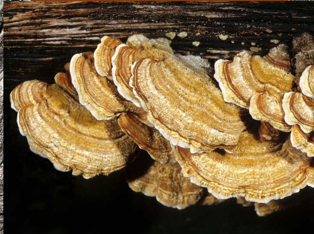
Plus ou moins décollé du support STEREUM