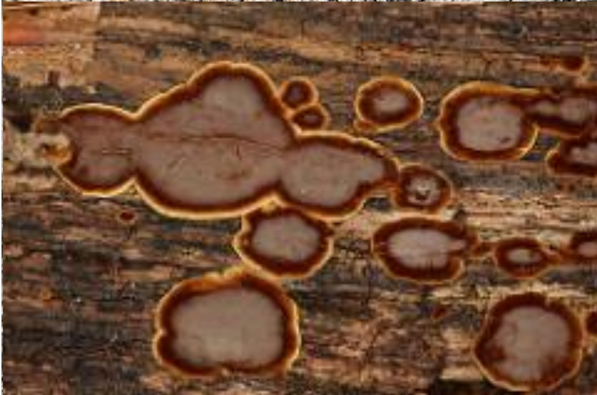
Croutes étalée sur le bois HYMENOCHAETE