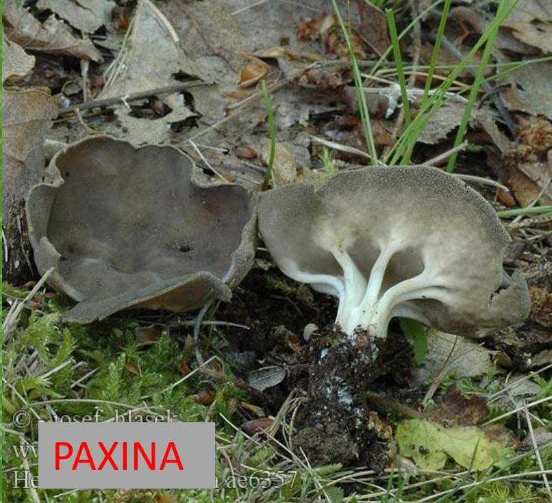
He PAXINA ae6357